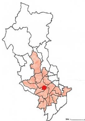
図 2 大阪府茨木市の小学校学区における「駄菓子屋のちゃん」の来店範囲

を行った「駄菓子屋のちゃん」では現在 18 の小学校区の子どもたちを顧客としている(図 2)。昔は小学校校区に 1 つはあった駄菓子屋だが、周りの駄菓子屋が減っていることから来客者の地理的範囲が拡大している。